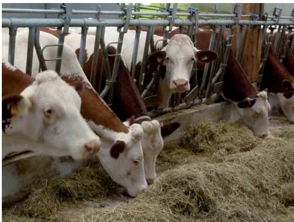
La suppression des quotas laitiers à l'hectare devrait favoriser la progression des grands élevages en bâtiments

La baisse du nombre d'exploitations laitières devrait se poursuivre dans les années à venir sous l'influence de trois facteurs principaux : l'augmentation de la productivité du travail est facilitée par l'arrivée des nouvelles technologies de traite (robotisation) ; la spécialisation de certaines exploitations autour de l'activité laitière pourrait se renforcer, quitte à externaliser certaines tâches telles que celles liées au travail du sol ; certaines exploitations individuelles fusionnent pour donner lieu à des structures multi-associés de plus grande taille (20 % des vaches laitières en France sont concentrées dans des étables de plus de 100 vaches). Le rythme de la restructuration à venir n'est cependant pas écrit à l'avance. Il dépendra aussi des nouvelles formes de relations contractuelles entre les producteurs et les industriels (modalités de transfert des contrats entre agriculteurs), de l'évolution du prix de l'énergie, des modalités d'attribution des aides directes de la PAC et des futurs rapports de prix entre productions agricoles. Avec la suppression des quotas, il demeure fort probable que la production laitière se concentrera davantage dans les zones et les exploitations les plus compétitives. Les politiques environnementales auront, sur ce point, une influence majeure car elles jouent parfois le rôle de contrepoids face aux phé-