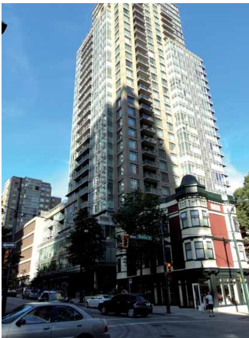
Tours résidentielles typiques de Vancouver.

Vancouver s'est créée autour d'un « deal » foncier. Son développement est intimement lié à l'arrivée du chemin de fer et une intense spéculation foncière avait précédé l'aboutissement de la ligne. À tel point que la Canadian Pacific Rail (CPR), la compagnie ferroviaire, qui ne possède que peu de terrains dans le site légalisé initialement s'arrangera pour que le terminus soit déplacé 19 km plus loin où ses perspectives foncières sont meilleures. La com-