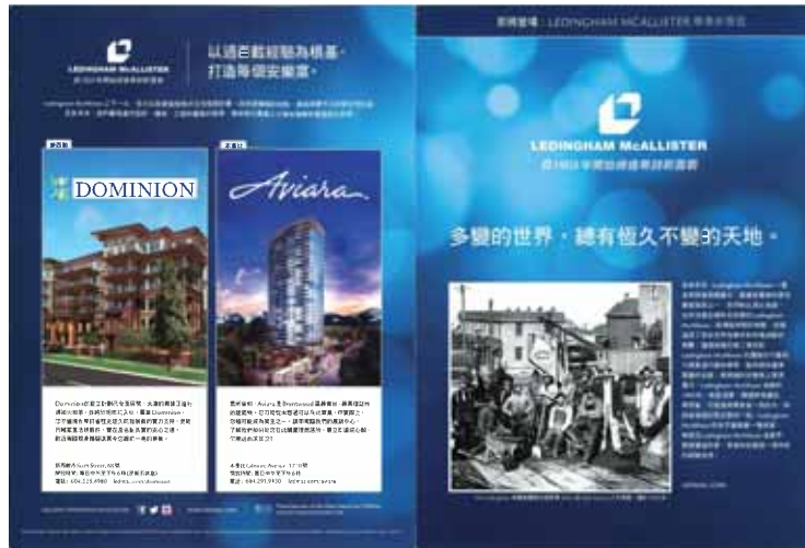
« Aujourd'hui et hier », brochure promotionnelle en chinois produite par l'un des plus anciens constructeurs de la ville.

Le gouvernement fédéral s'implique dans la production de logements pour deux motifs. D'abord, l'ampleur de la demande latente exige une réponse massive, et l'État souhaite le développement d'une véritable industrie immobilière privée. Ensuite, la stimulation du secteur immobilier est vue comme un moyen de stabiliser le développement éco-