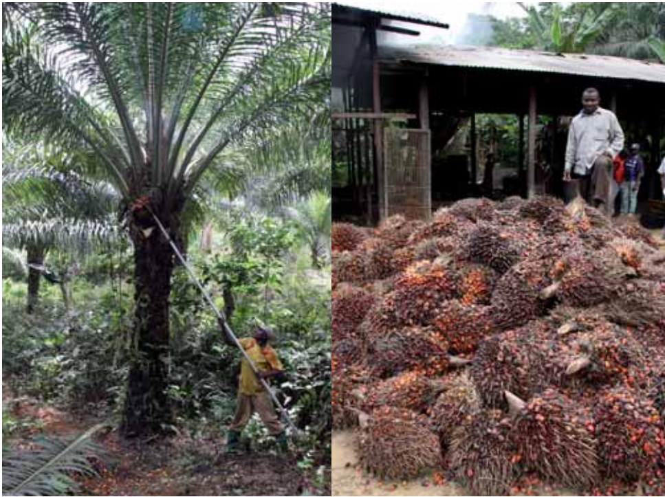
Cueillette et récolte des fruits du palmier.