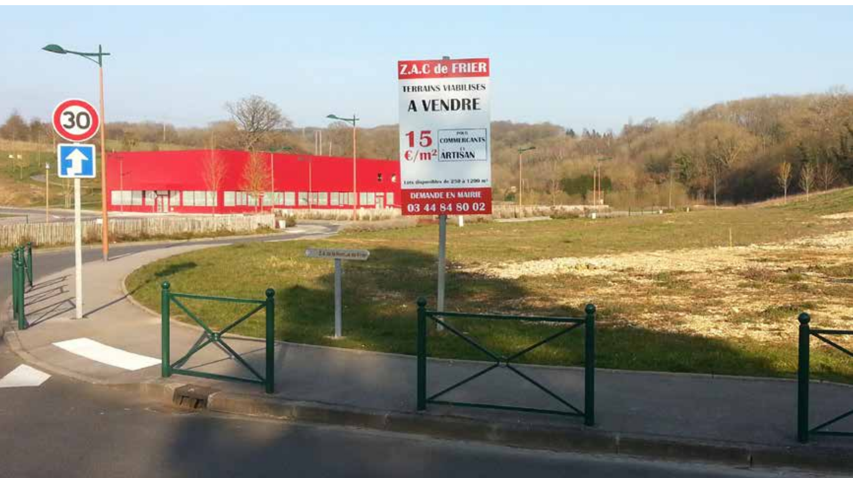
Terrain d'activité à 70 km de Paris, en bordure d'une route nationale.